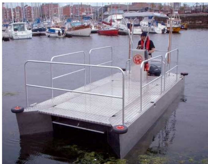
Les plaques du pont forment une plate-forme de travail de 13 m 2